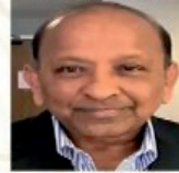
Divakar Jandyam Physician & Family Services