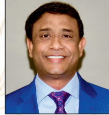
Hari Raini Immediate Past President