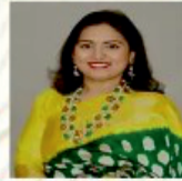
Sallaja Grandhi Cultural