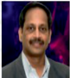
Naga Mahendar Velishala Membership