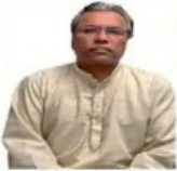
Balanand Pinni Spiritual