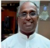
Rajkumar Channa Helpline