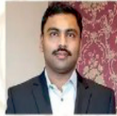
Bhargava Venishetty Chapter Coordination