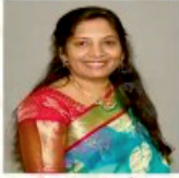
Prasanna Sontha Matrimony